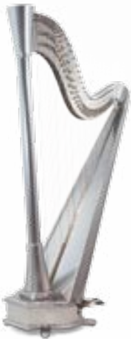
Mini Blue 44 - finition chromée

Bois utilisés : érable, et épicéa pour la table d'harmonie. Finitions : bleue, ou toute finition sur demande Woods used: maple, and spruce for the soundboard. Finish: blue, or any finish on request