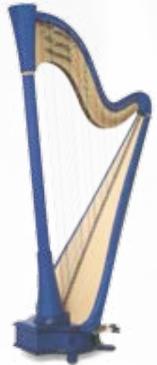
Big Blue 47

Taille / Size: 170 cm Poids / Weight: 29 kg Tessiture : 44 cordes de Sol 00 à Fa 42 Range: 44 strings from G00 to F42