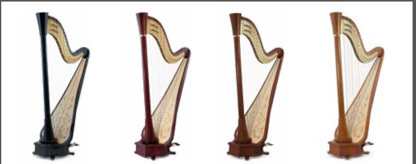
ébène / ebony