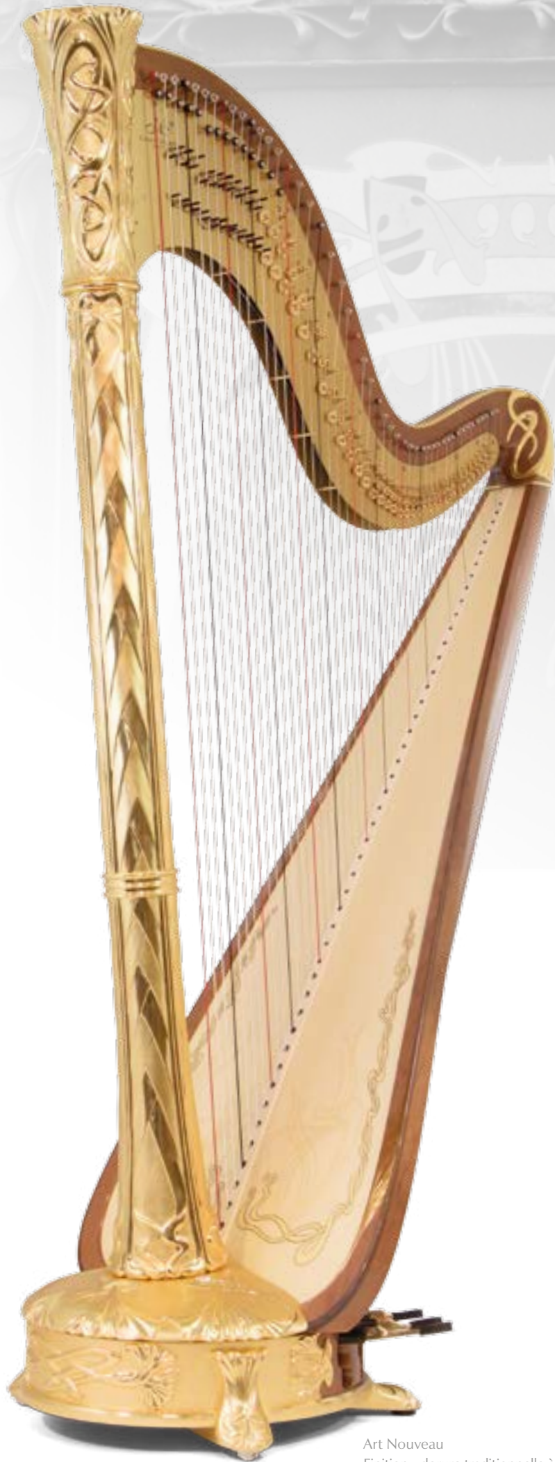
Art Nouveau Finition : dorure traditionnelle à la feuille d'or 24 carats / 24-carat water gilding