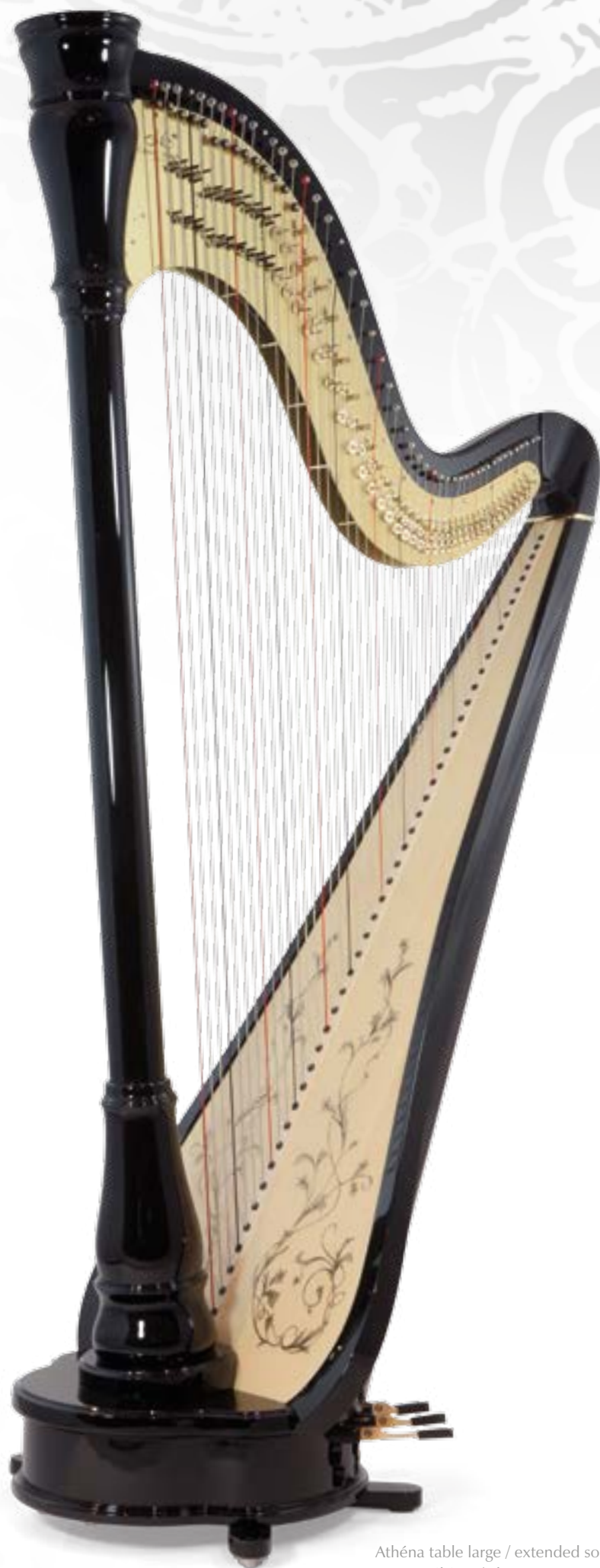
Athéna table large / extended soundboard Finition ébène / ebony