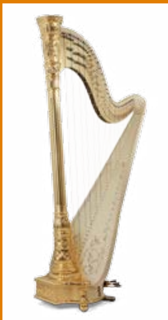
Oriane 47 47 cordes / 47 strings Finition érable naturel / natural maple

The Oriane Concert Grand harp is entirely dedicated to musical perfection, offering concert artists a sound of incomparable purity and exceptional power. A seamless extension of harpists themselves, fully to voice their talent and love of music, the Oriane 47 is a rare pearl for the finest soloists. It is also a veritable work of art, carved and gilded by hand, and made of woods rigorously chosen for their extraordinary acoustic performance.