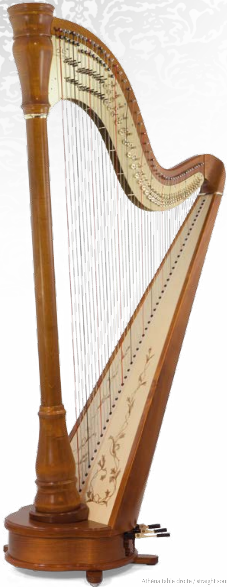
Athéna table droite / straight soundboard Finition merisier / cherrywood