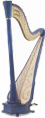
Little Big Blue 44