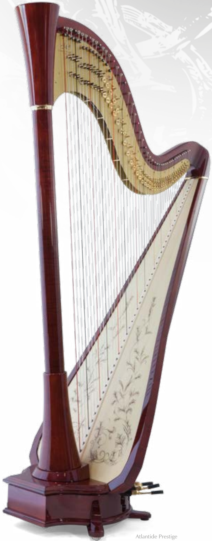
Atlantide Prestige Finition acajou / mahogany