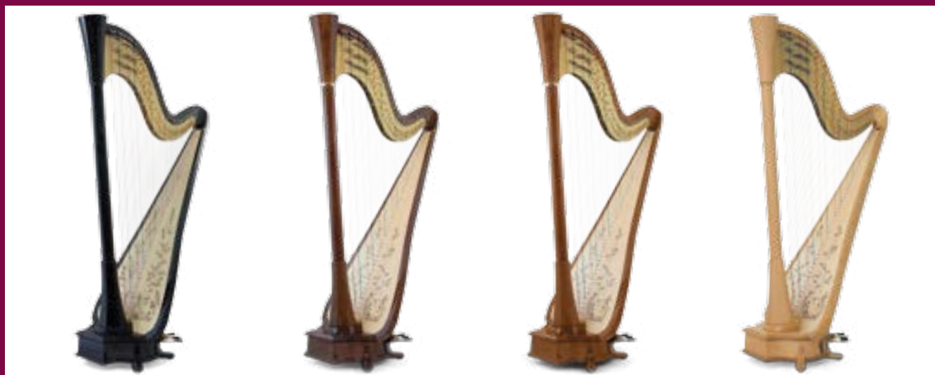
ébène / ebony