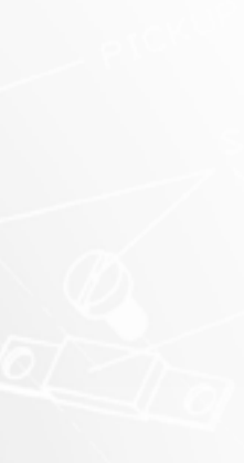
Big Blue 47 table large / extended soundboard