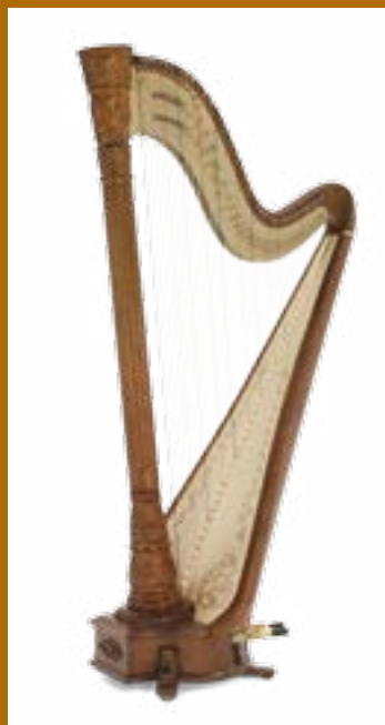
Trianon 44 44 cordes / 44 strings Finition acajou / mahogany

The Trianon 47 is a concert harp distinguished by its exceptional hand-carving. It was developed by a meilleur ouvrier de France, a prestigious appellation meaning "best craftsman of France". Hand-carving on open wood also requires a special selection of the most perfect American maple. The result is an instrument of breathtaking appearance, and fabulous sound.