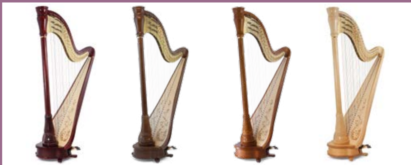
acajou / mahogany