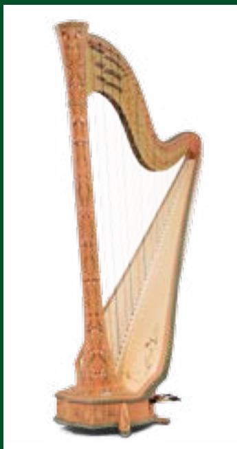
Canopée Finition : poirier Marqueterie : sycomore et noyer Inserts de nacre blanche