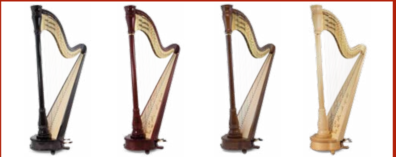
ébène / ebony