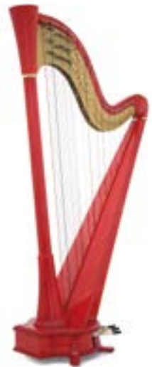
Solid Body 47

Taille / Size: 170 cm Poids / Weight: 29 kg Tessiture : 44 cordes de Sol 00 à Fa 42 Range: 44 strings from G00 to F42