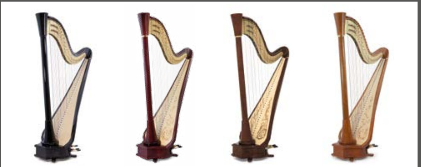
ébène / ebony