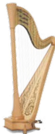
naturel / natural