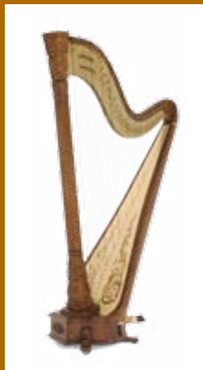
Trianon 44 44 cordes / 44 strings acajou / mahogany

La harpe Trianon partage avec l'Atlantide Prestige les plus hautes spécifications professionnelles. Ses bois, tout particulièrement sélectionnés, sculptés à la main, font d'elle un instrument beau à couper le souffle et à la sonorité fabuleuse. Entendue et vue de par le monde sur les scènes les plus diverses et les plus prestigieuses, la Trianon exprime à la perfection l'art chatoyant des harpistes.