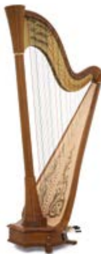
merisier / cherry