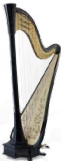
ébène / ebony