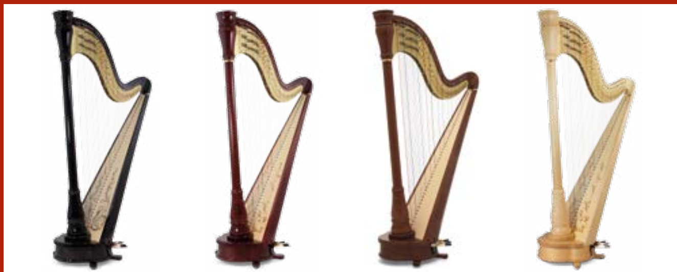
ébène / ebony