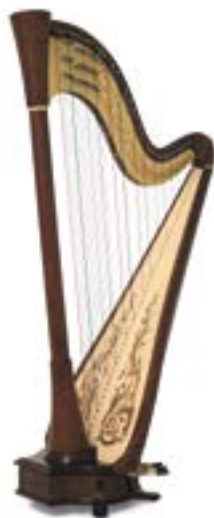
noyer / walnut