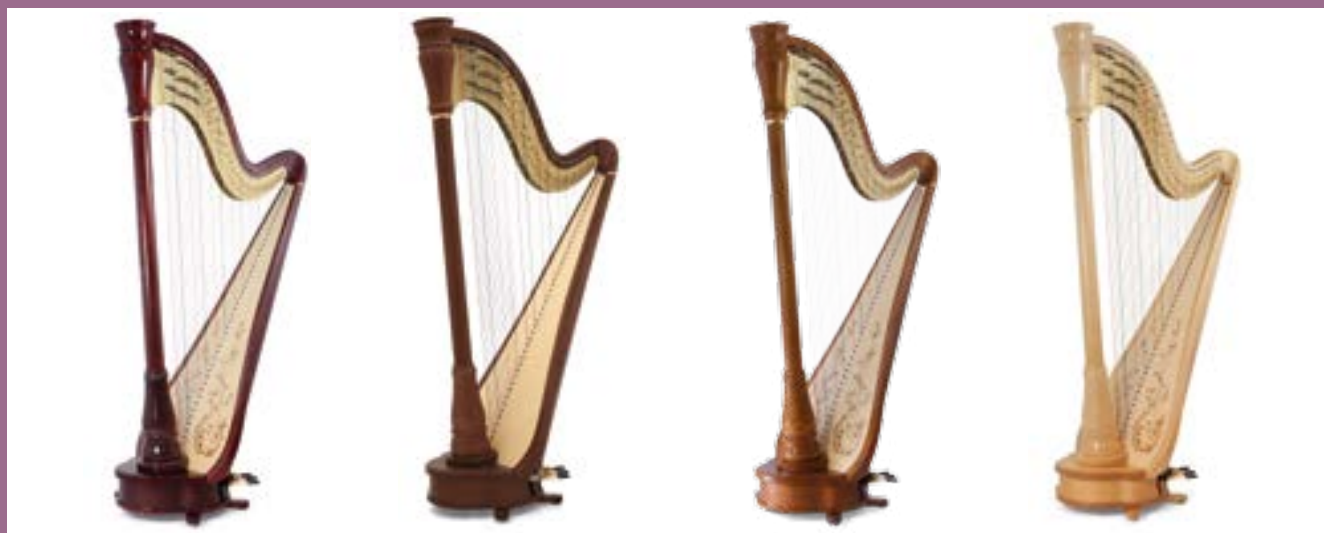
acajou / mahogany