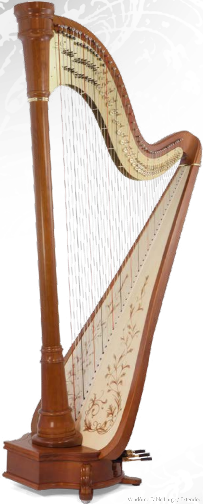
Vendôme Table Large / Extended Soundboard Finition Merisier naturel / Natural cherry