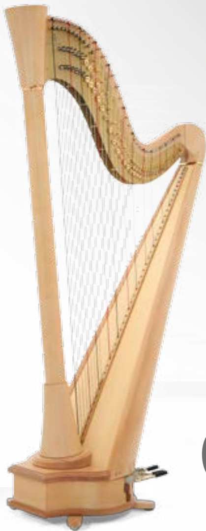
Mini Blue Finition érable naturel / natural maple