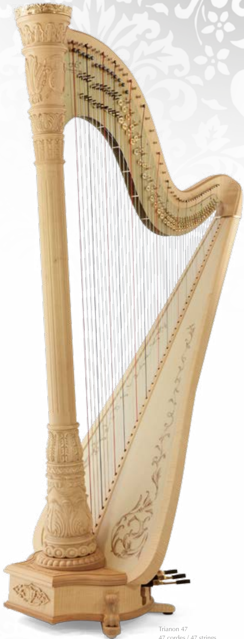
Trianon 47 47 cordes / 47 strings Finition érable naturel / natural maple