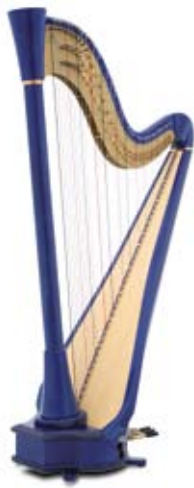
Little Big Blue 44

Taille / Size: 170 cm Poids / Weight: 29 kg Tessiture : 44 cordes de Sol 00 à Fa 42 Range: 44 strings from G00 to F42