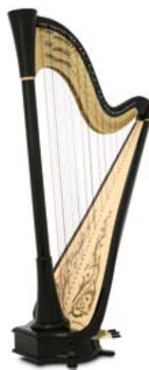
ébène / ebony