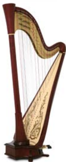
acajou / mahogany