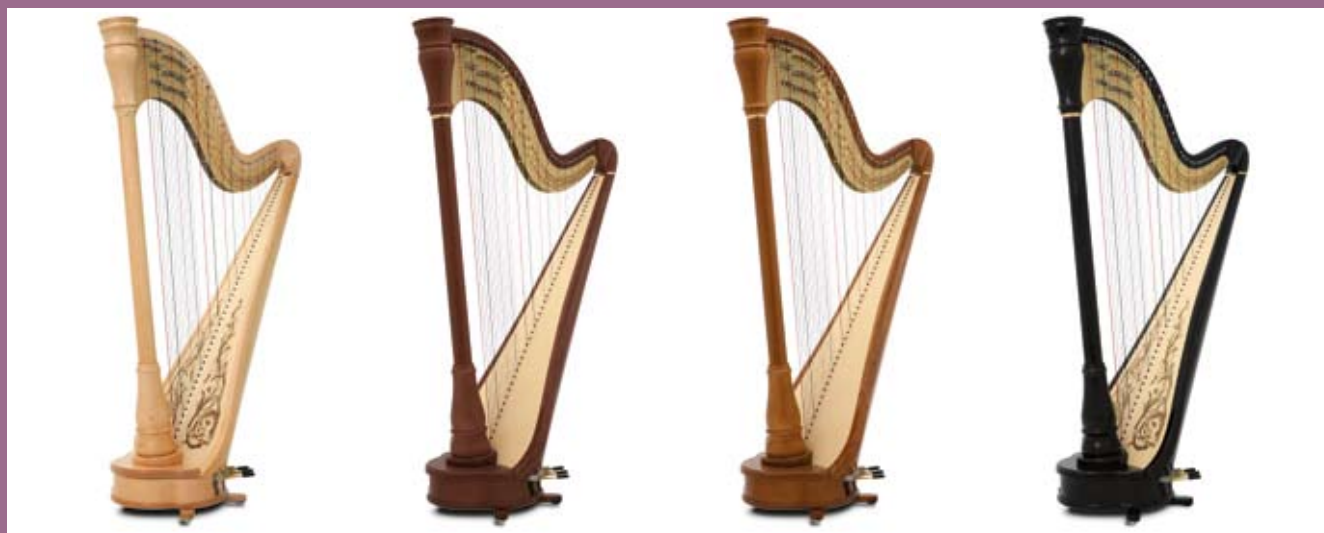
érable naturel / natural maple