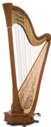
merisier / cherry