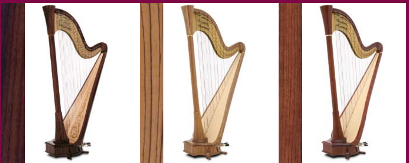
palissandre / rosewood