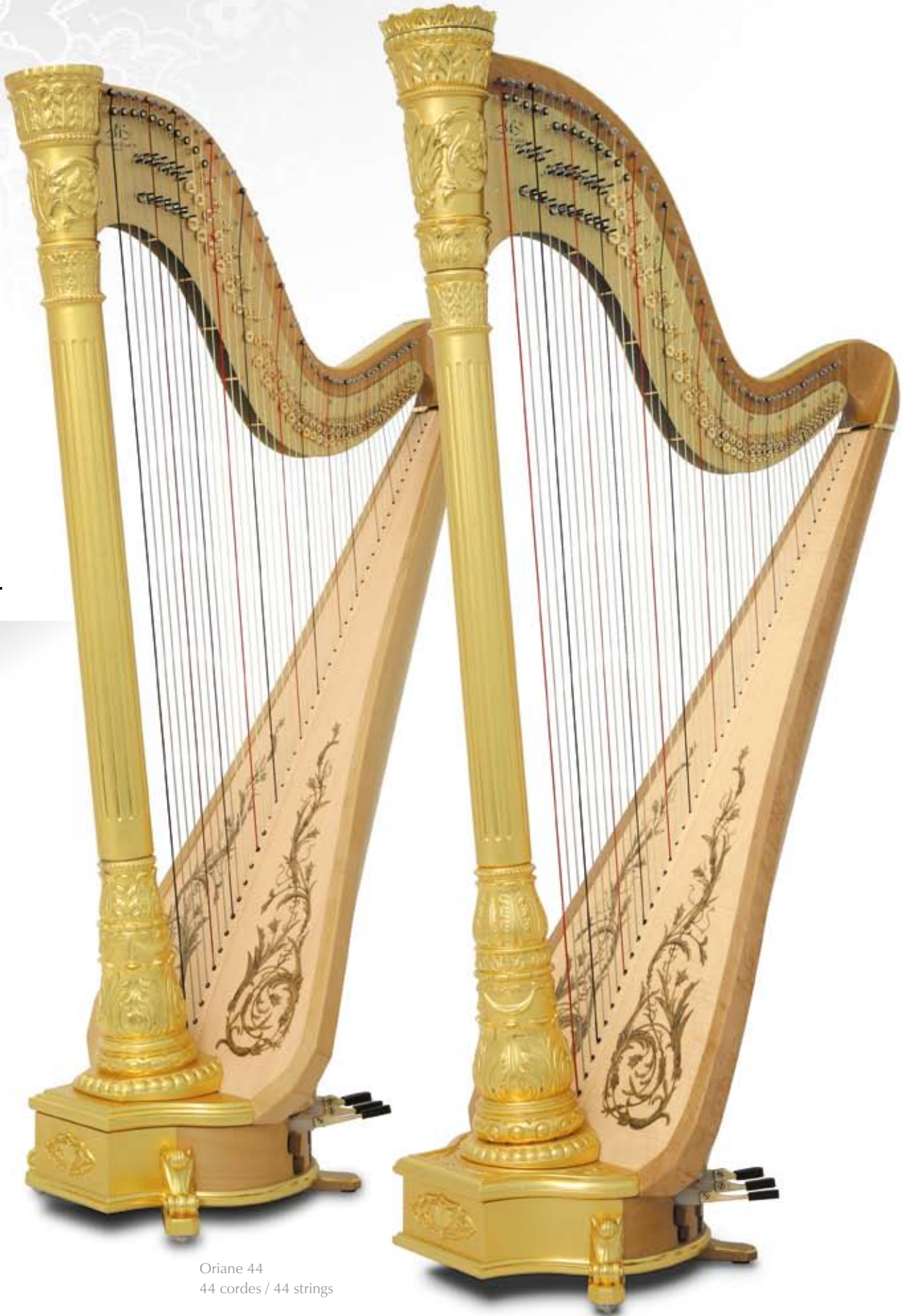
Oriane 44 44 cordes / 44 strings