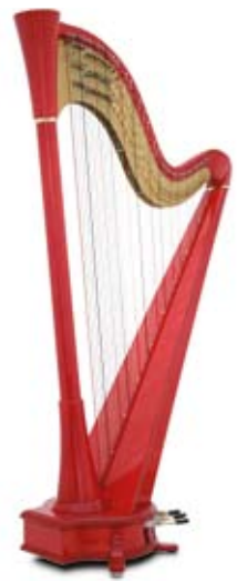
Solid Body 47

Taille / Size: 185 cm Poids / Weight: 36 kg Tessiture : 47 cordes de Sol 00 à Do 45 Range: 47 strings from G00 to C45