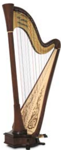
noyer / walnut