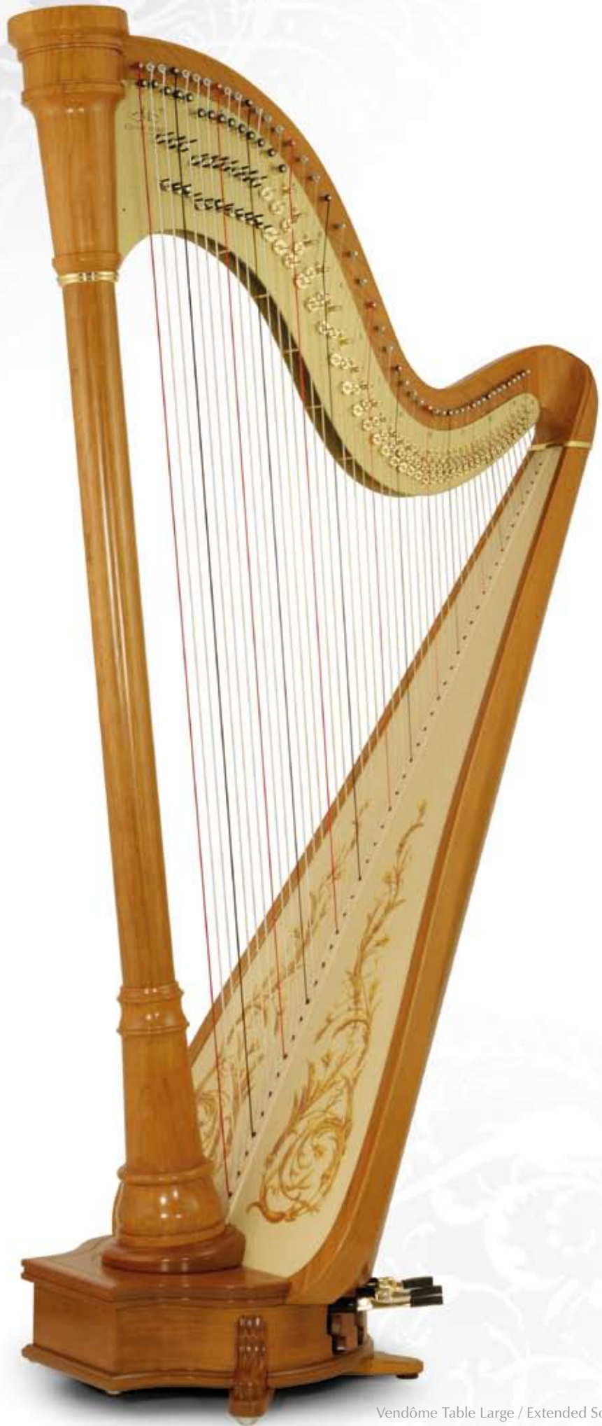
Vendôme Table Large / Extended Soundboard Finition Merisier naturel / Natural cherry