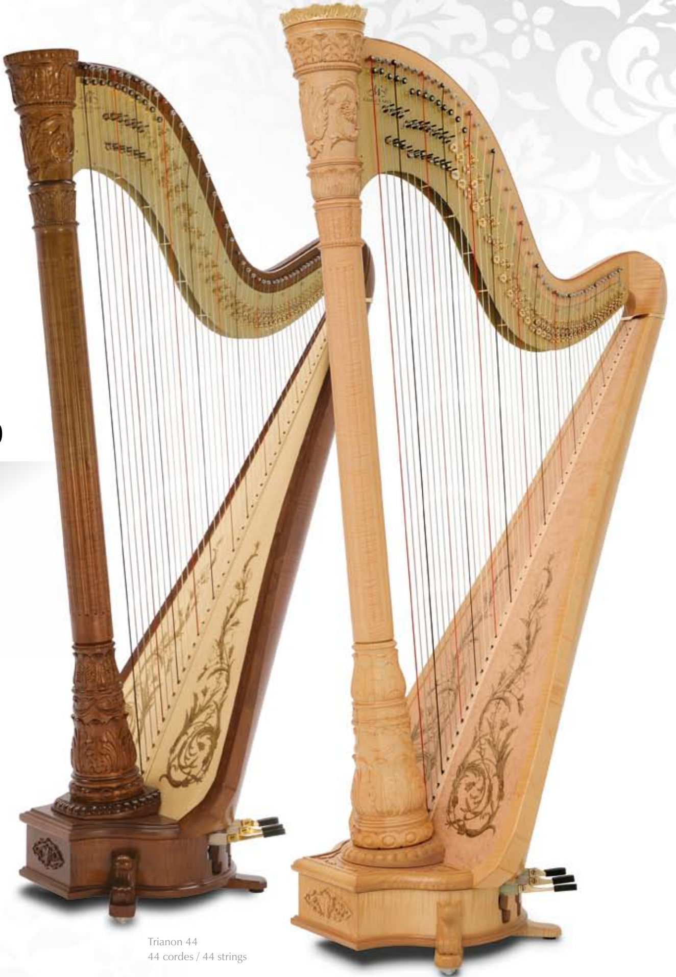
Trianon 44 44 cordes / 44 strings