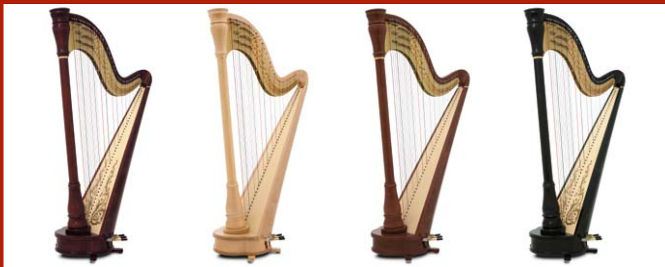
acajou / mahogany