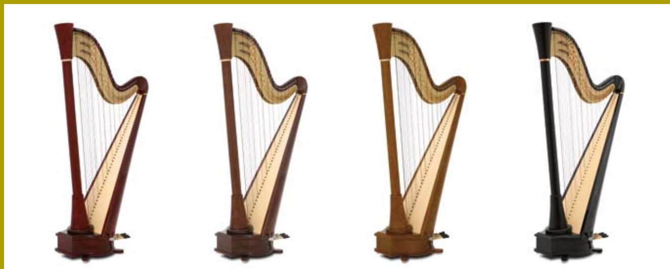
acajou / mahogany