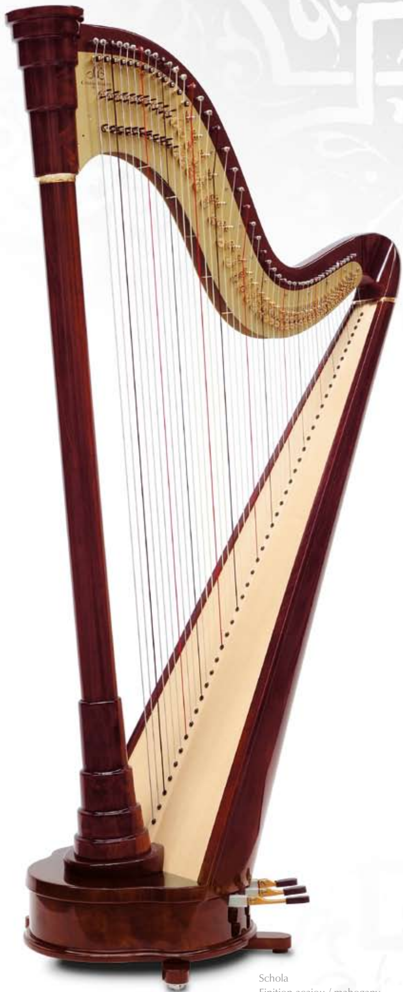
Schola Finition acajou / mahogany