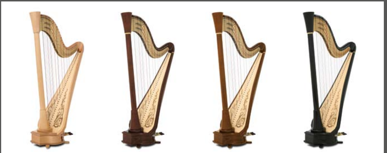
érable naturel / natural maple