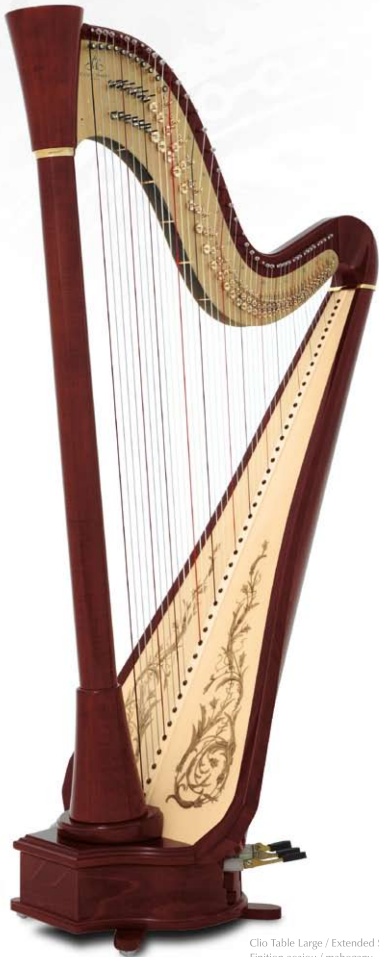
Clio Table Large / Extended Soundboard Finition acajou / mahogany